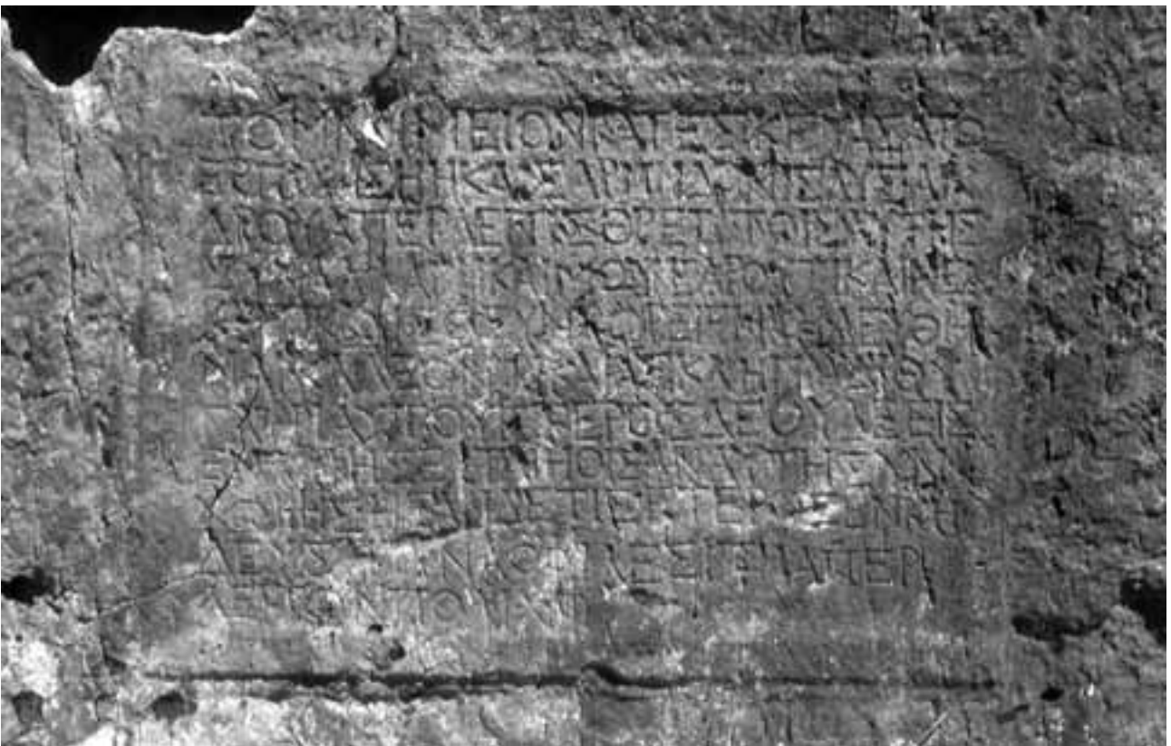
Abb. 46 Text of the Inscription