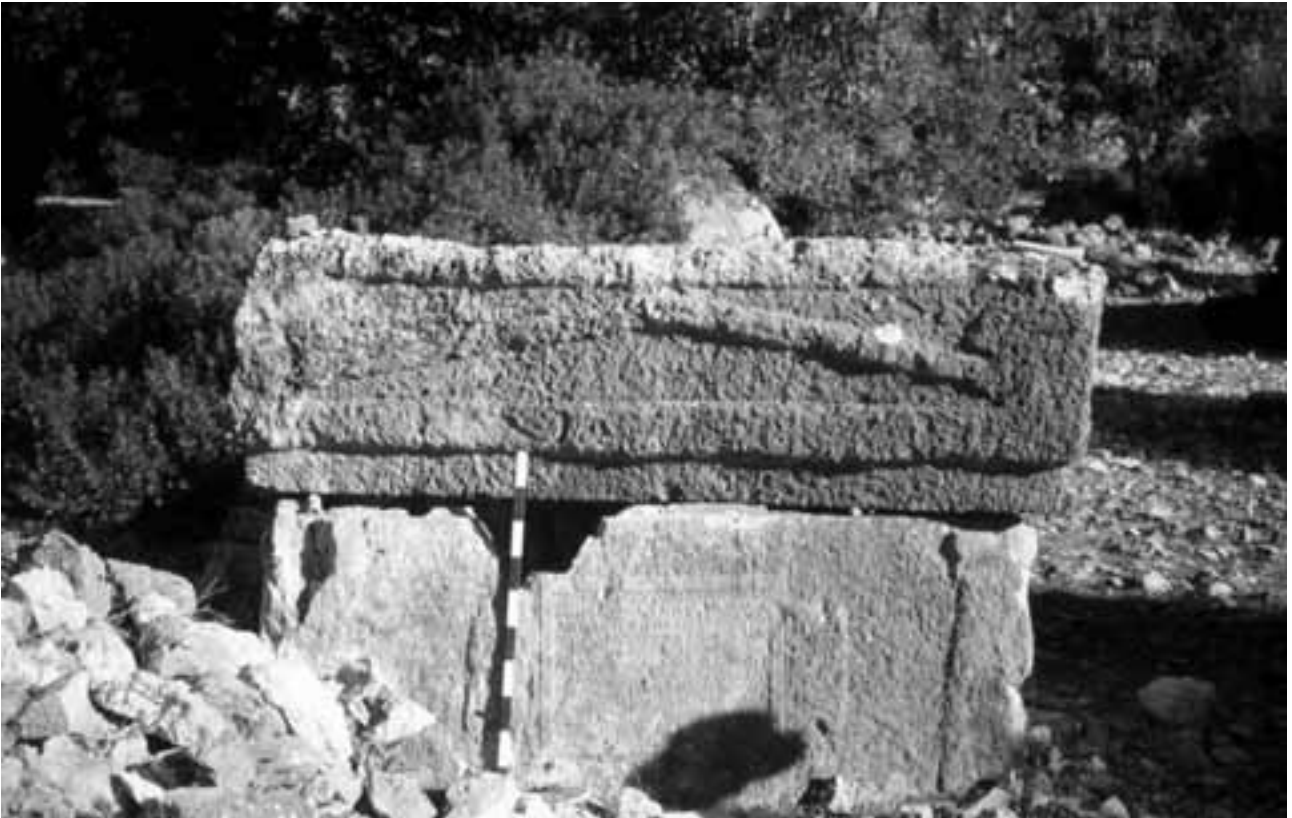
Abb. 45 Tomb 50 at Aperlae