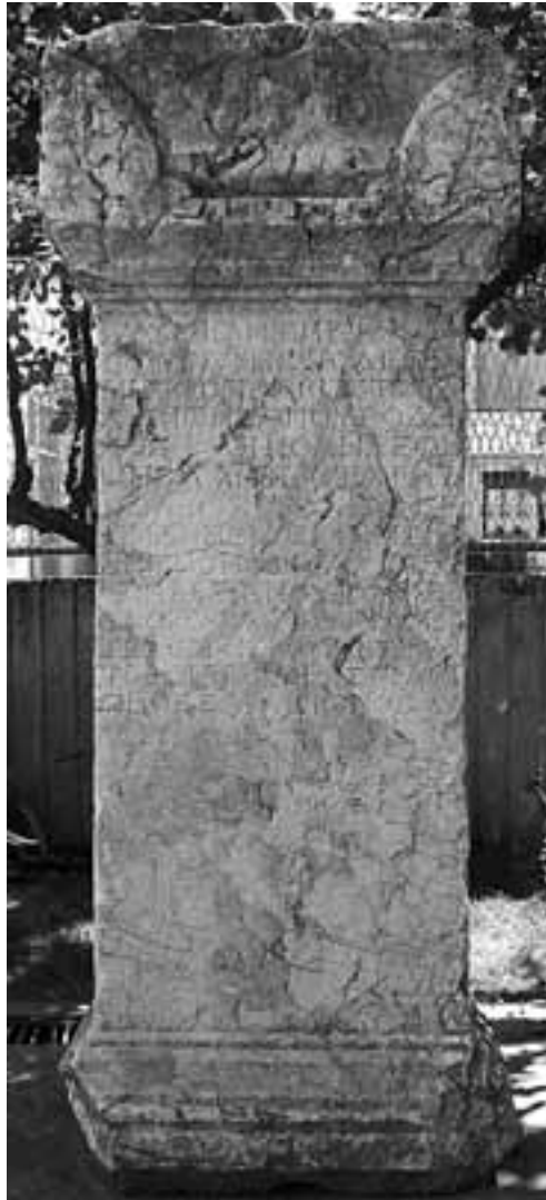
Abb. 48 La base de statue au musée de Fethiye