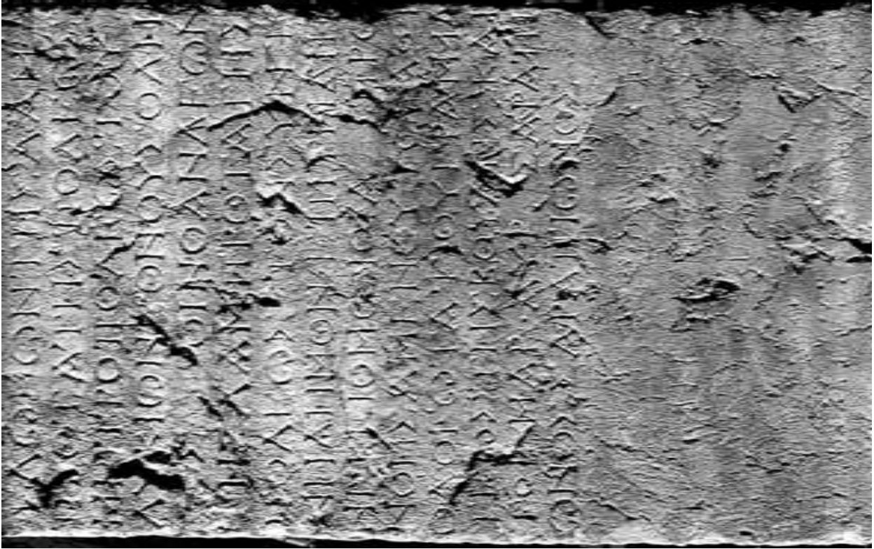
Abb. 51 La face inscrite de la base (clichés et montage D. Rousset)