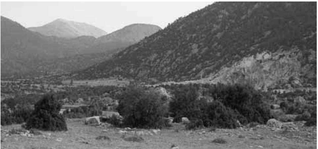
Abb. 49 Vue de Kemerarası en direction du Sud-Sud-Ouest. Au premier plan, la partie Sud du site de Kemerarası; au second plan à droite, la carrière de calcaire marbrier entaillant le piémont; c'est dans l'ensellement entre ce piémont et le sommet voisin (en arrière au centre) que se trouve dissimulée la ville d'Oinoanda