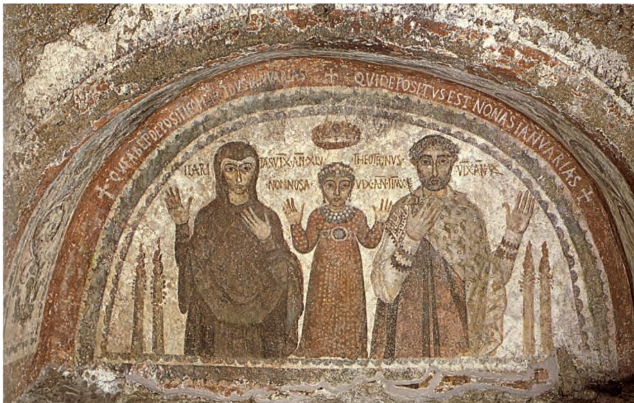
Abb. 4: Neapel, Katakombe des Hl. Januarius: Familiengrab des Theotecnus