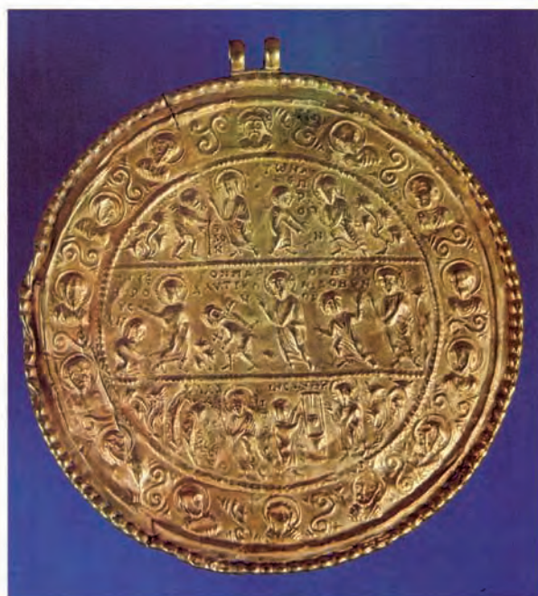
Abb. 10: Istanbul, Archäologisches Museum: Inv.-Nr. 82 A