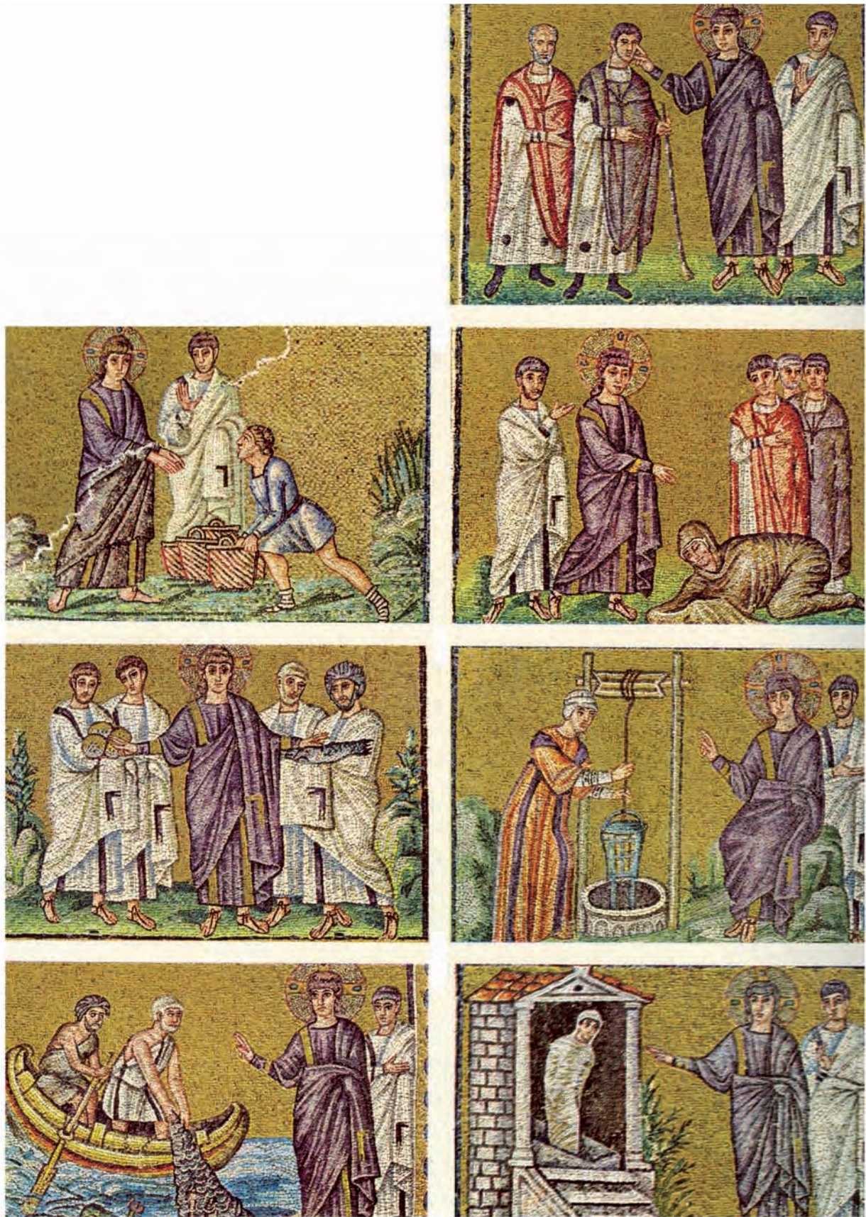
Abb. 15: Ravenna, S. Apollinare Nuovo: Wunderzyklus (Teil)