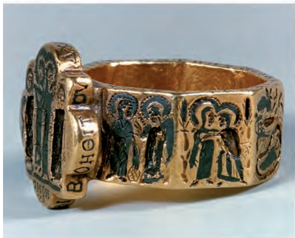
Abb. 9: Washington, Dumbarton Oaks Collection