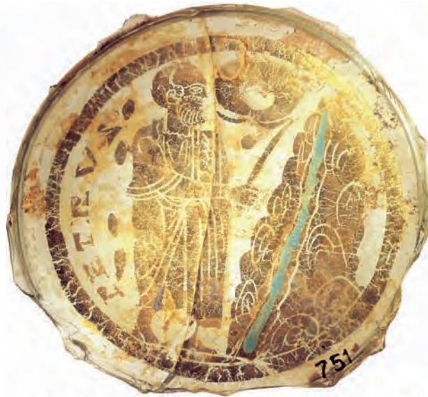
Abb. 11: Città del Vaticano, Museo Sacro: Inv.-Nr. 60751