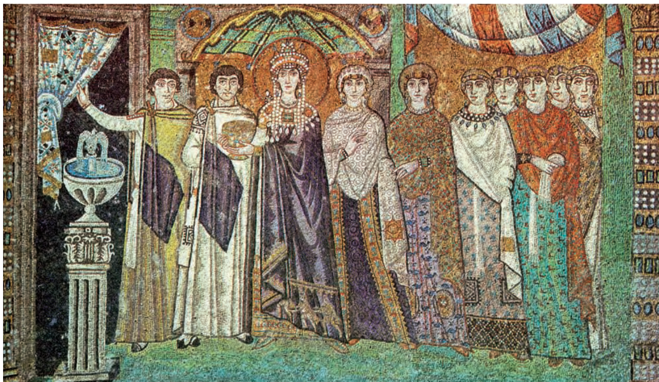
Abb. 8: Ravenna, S. Vitale: Kaiserin Theodora mit Gefolge