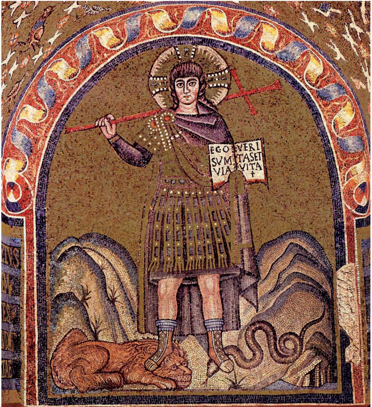
Abb. 16: Ravenna, Cappella Arcivescovile: Christus militans