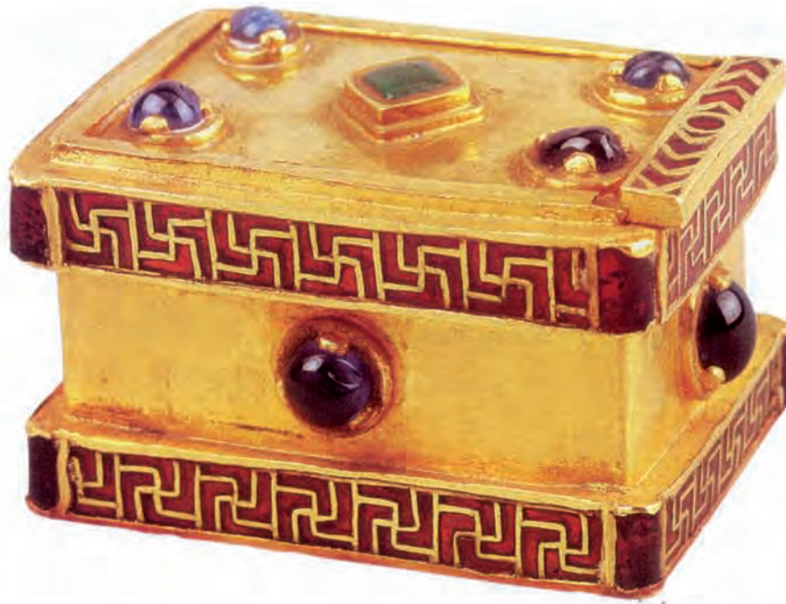
Abb. 6: Varna, Archäologisches Museum: Inv.-Nr. III-768