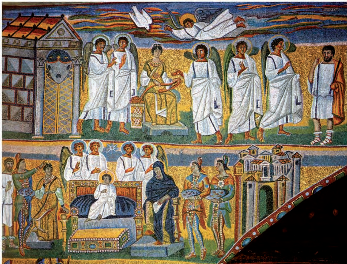
Abb. 2: Rom, S. Maria Maggiore: Triumphbogen (links oben)