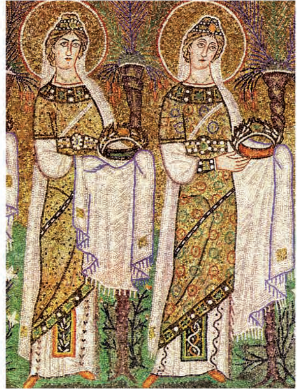
Abb. 3: Ravenna, S. Apollinare Nuovo: Zug der Martyrerinnen (Detail)