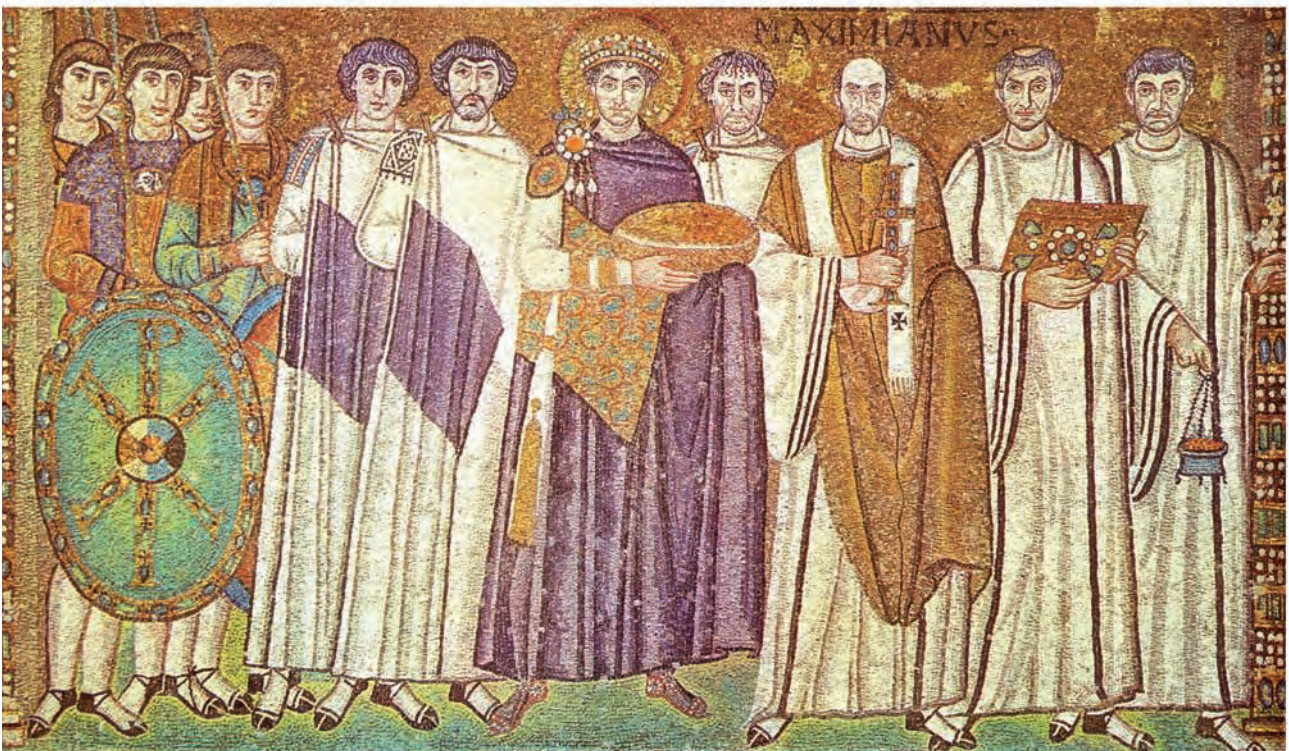
Abb. 7: Ravenna, S. Vitale: Kaiser Justinian mit Gefolge