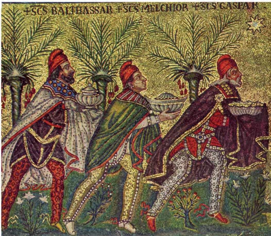
Abb. 14: Ravenna, S. Apollinare Nuovo: Anbetung der Magier (Detail)