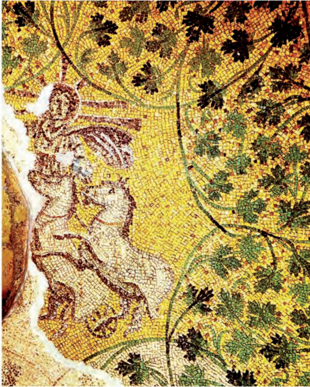
Abb. 1: Rom, Nekropole unter St. Peter: Julierhypogäum (Decke)