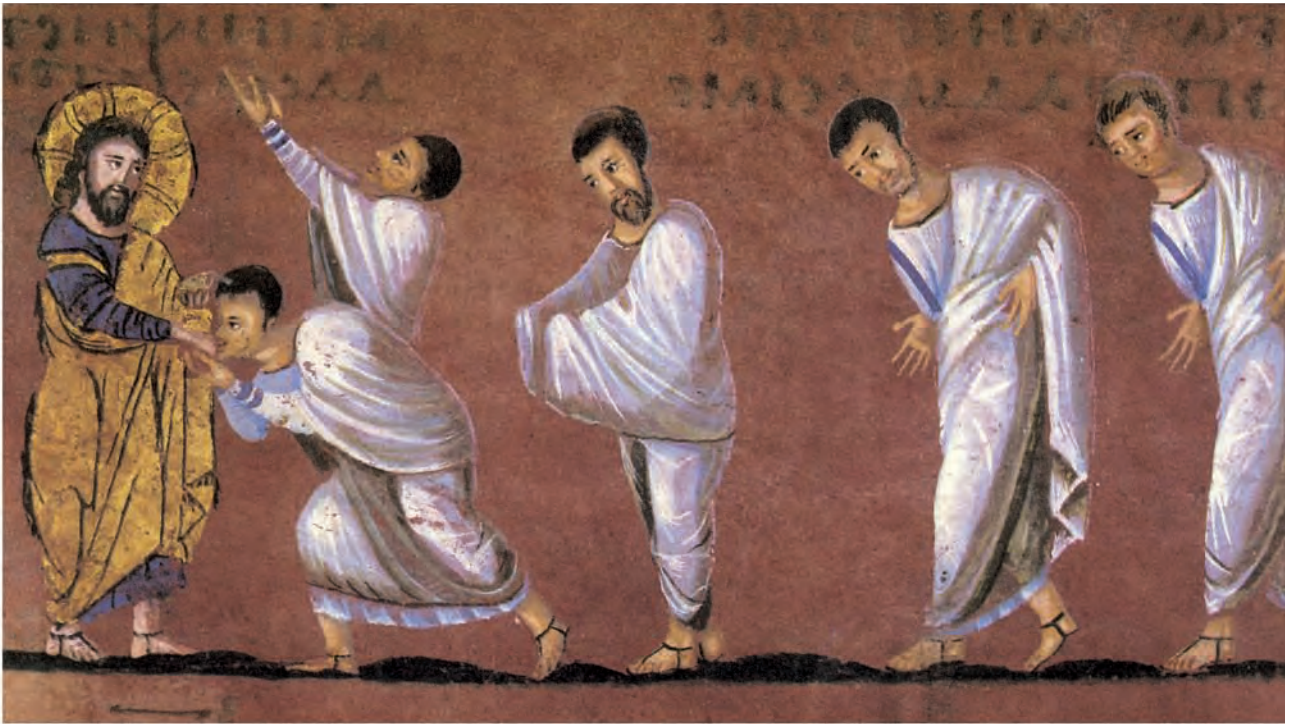
Abb. 13: Rossano, Museo dell' Arcivescovado: Codex purpureus f. 3 v