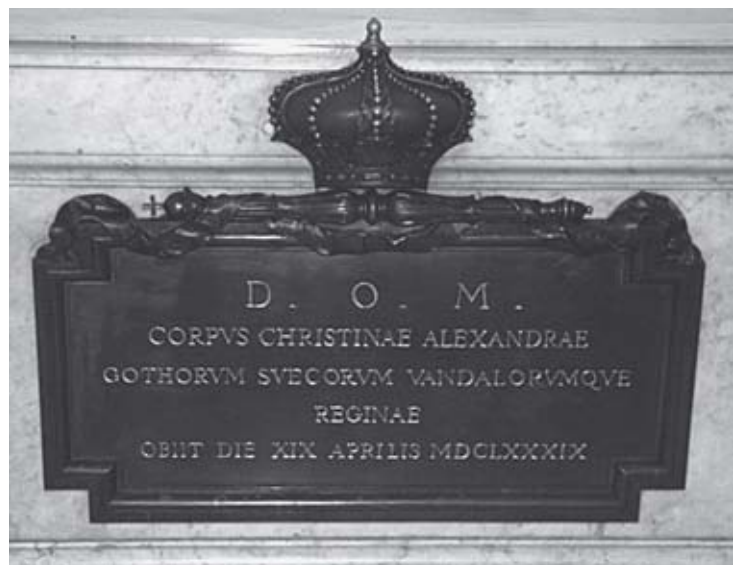
Abb. 2: Grabmal der Königin Christina († 1689), Basilica di San Pietro