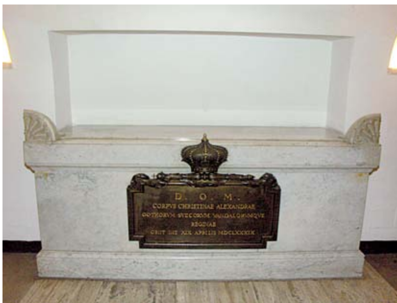
Abb. 2: Grabmal der Königin Christina († 1689), Basilica di San Pietro