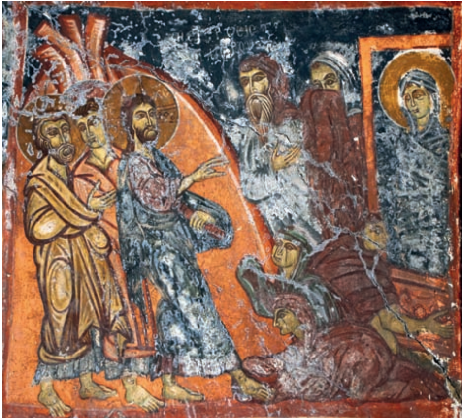
Abb. 148: Kadros, Panagia. Erweckung des Lazarus