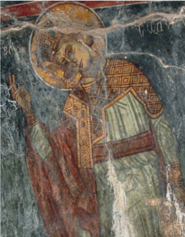
Abb. 139: Anisaraki, Hagia Paraskevi. Salomo