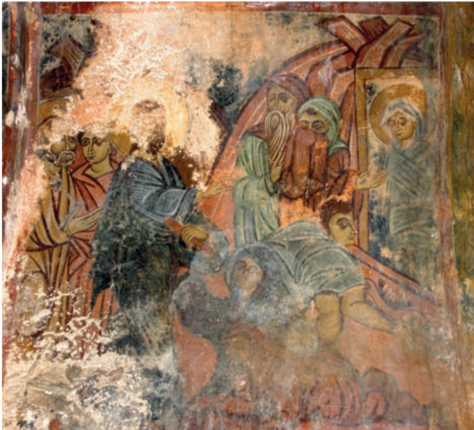
Abb. 153: Trachiniakos, Prophet Elias. Erweckung des Lazarus