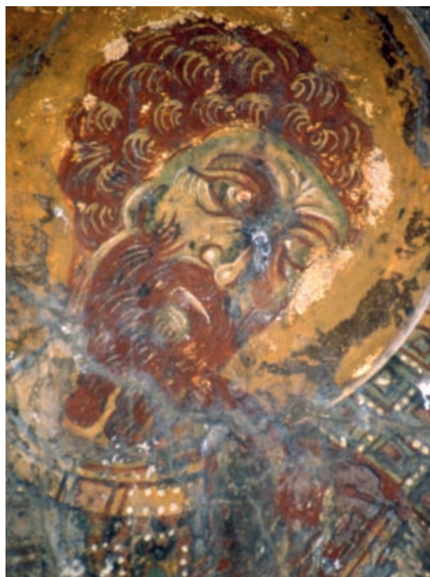
Abb. 134: Prines, Panagia. Hl. Theodoros