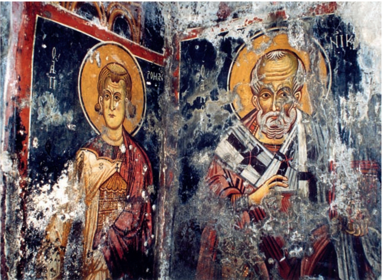
Abb. 144: Kadros, Panagia. Diakon Romanos und Hl. Nikolaos