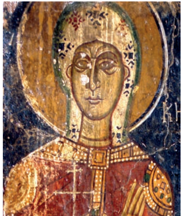
Abb. 151: Trachiniakos, Prophet Elias. Hl. Kyriaki