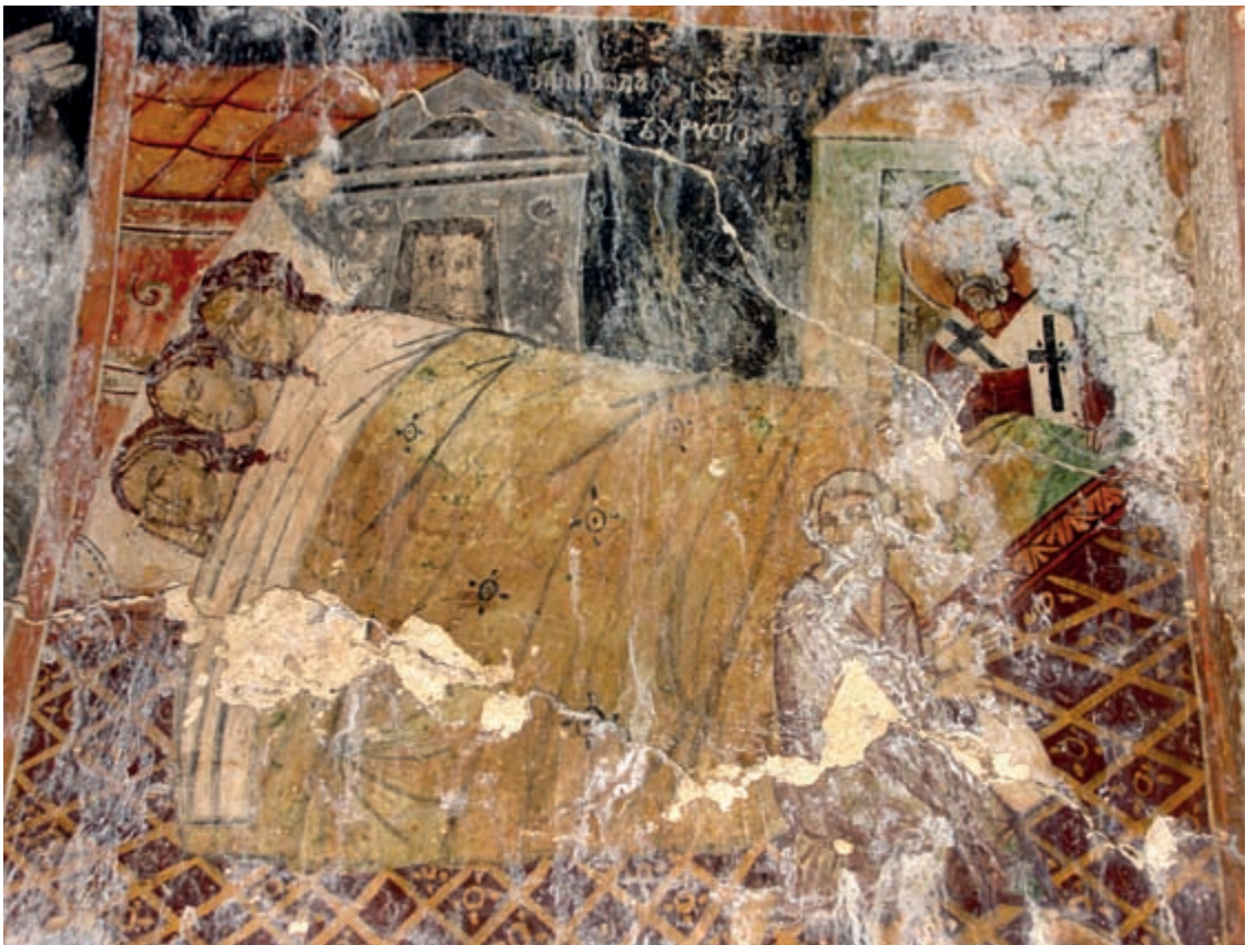
Abb. 132: Kitiros, Hagios Nikolaos. Szene aus dem Nikolaoszyklus