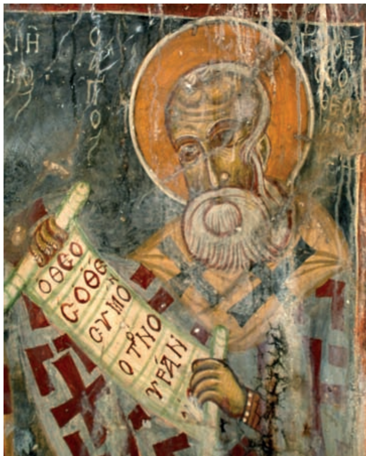
Abb. 141: Anisaraki, Hagia Paraskevi. Gregor von Nazianz