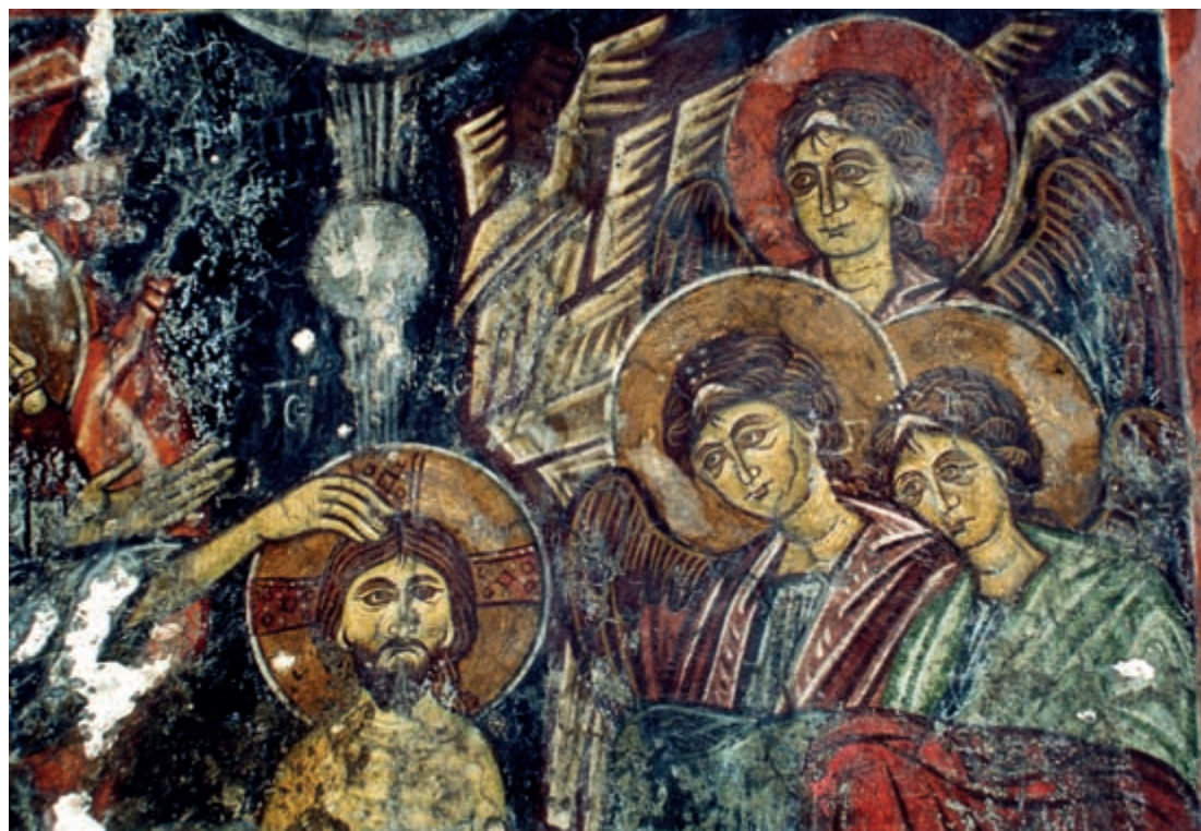
Abb. 146: Kadros, Panagia. Taufe Christi