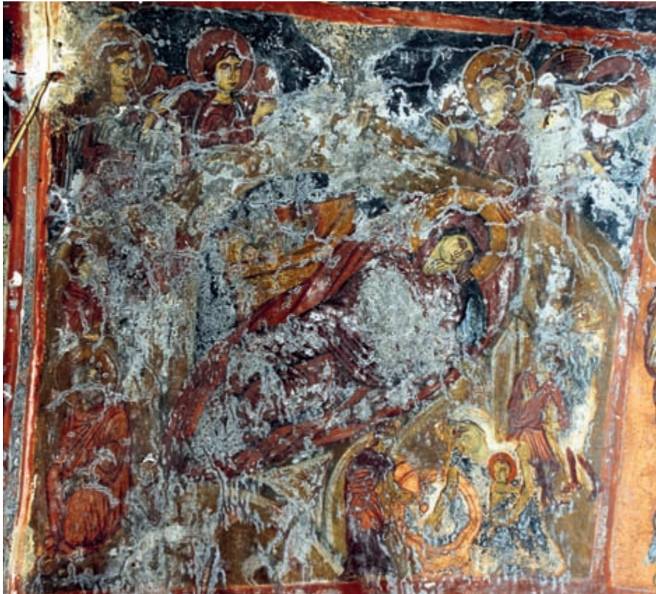
Abb. 147: Kadros, Panagia. Geburt