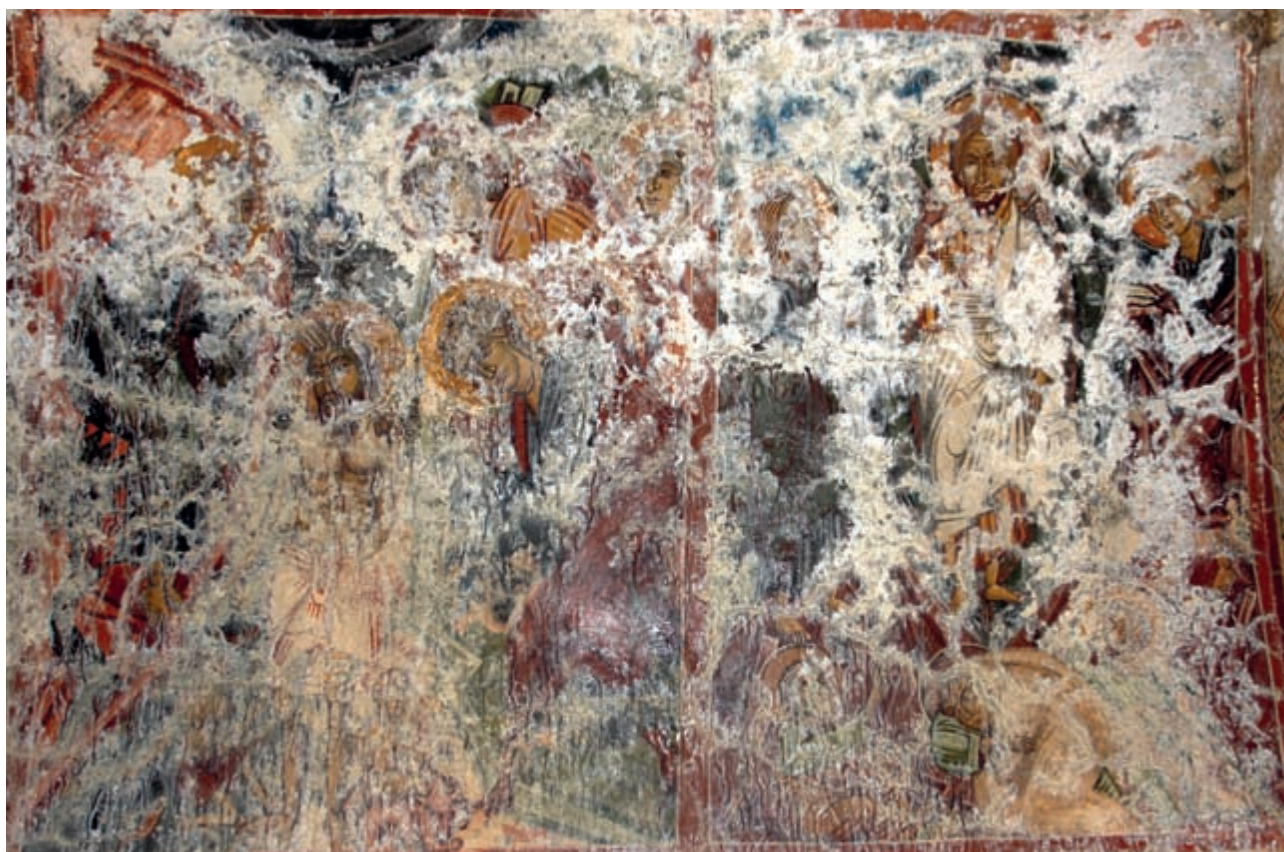
Abb. 129: Kitiros, Hagios Nikolaos. Taufe und Verklärung Christi