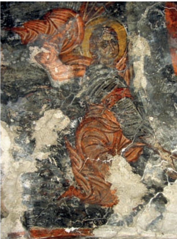
Abb. 137: Prines, Panagia. Himmelfahrt