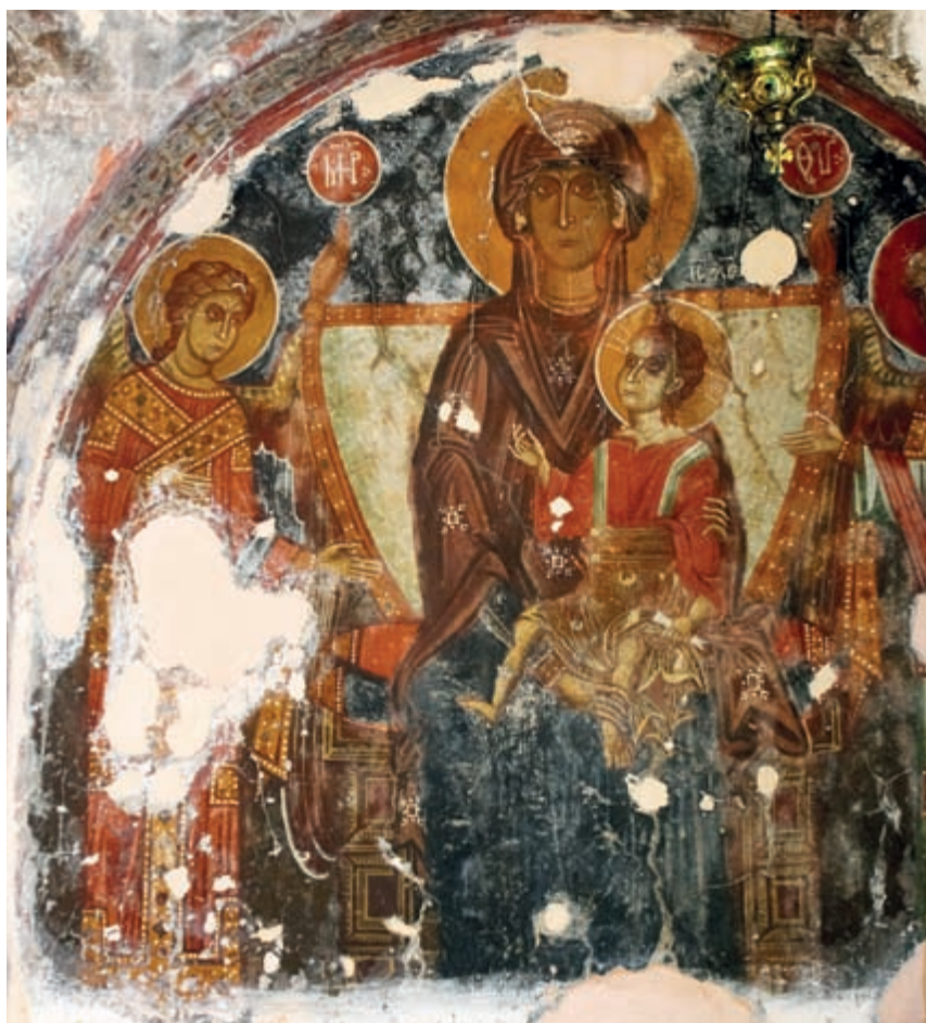
Abb. 145: Kadros, Panagia. Thronende Maria mit Kind