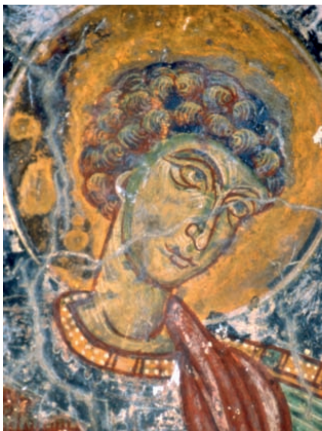
Abb. 133: Prines, Panagia. Hl. Georgios