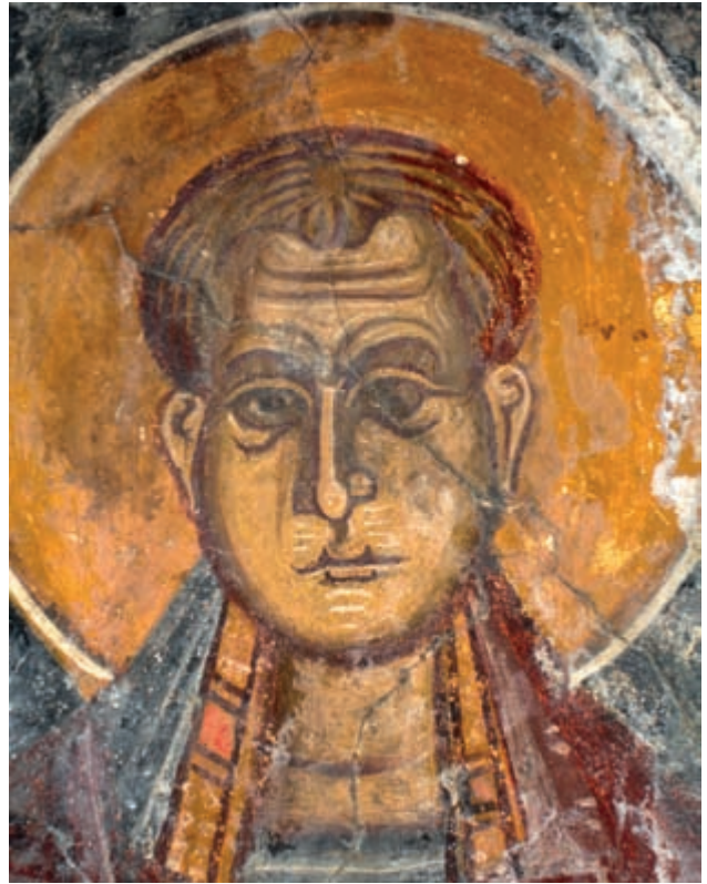
Abb. 140: Anisaraki, Hagia Paraskevi. Hl. Damian