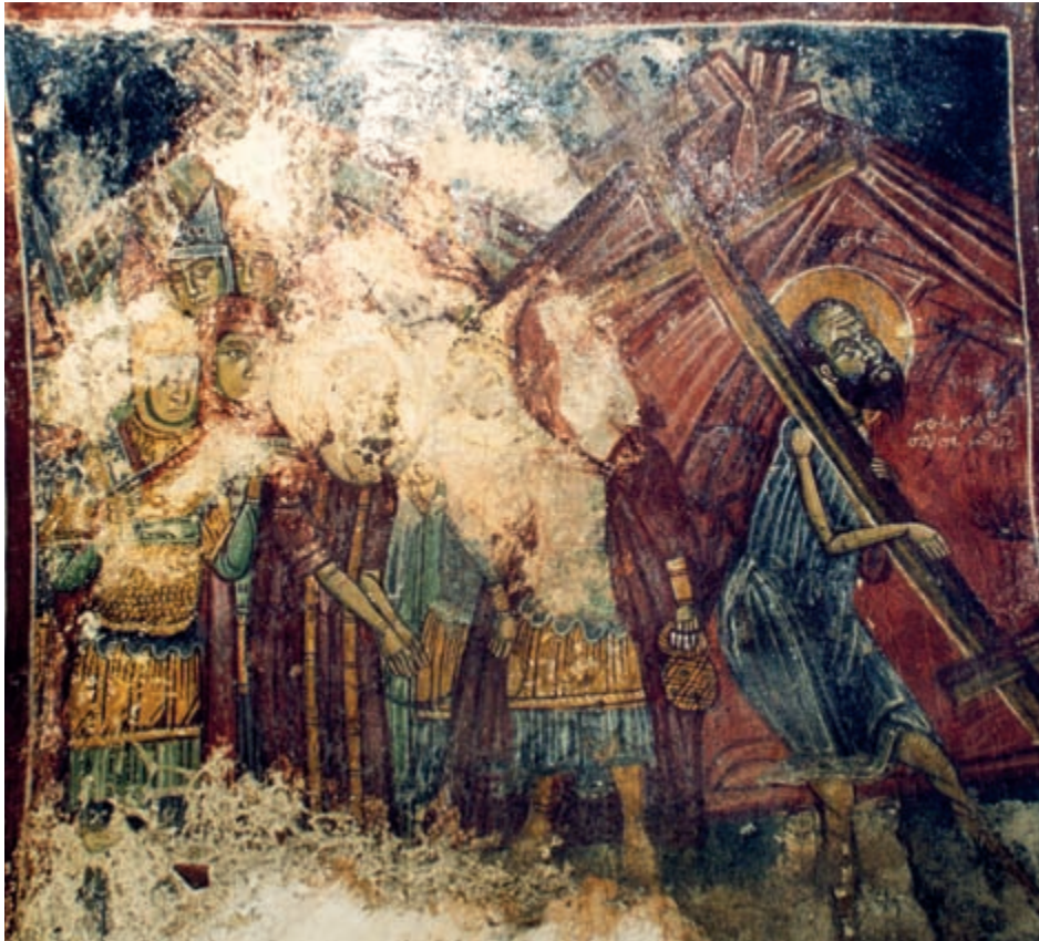
Abb. 152: Trachiniakos, Prophet Elias. Helkomenos