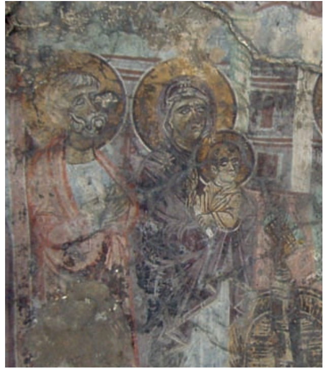
Abb. 143: Lofos, Hagios Mamas. Darbringung im Tempel