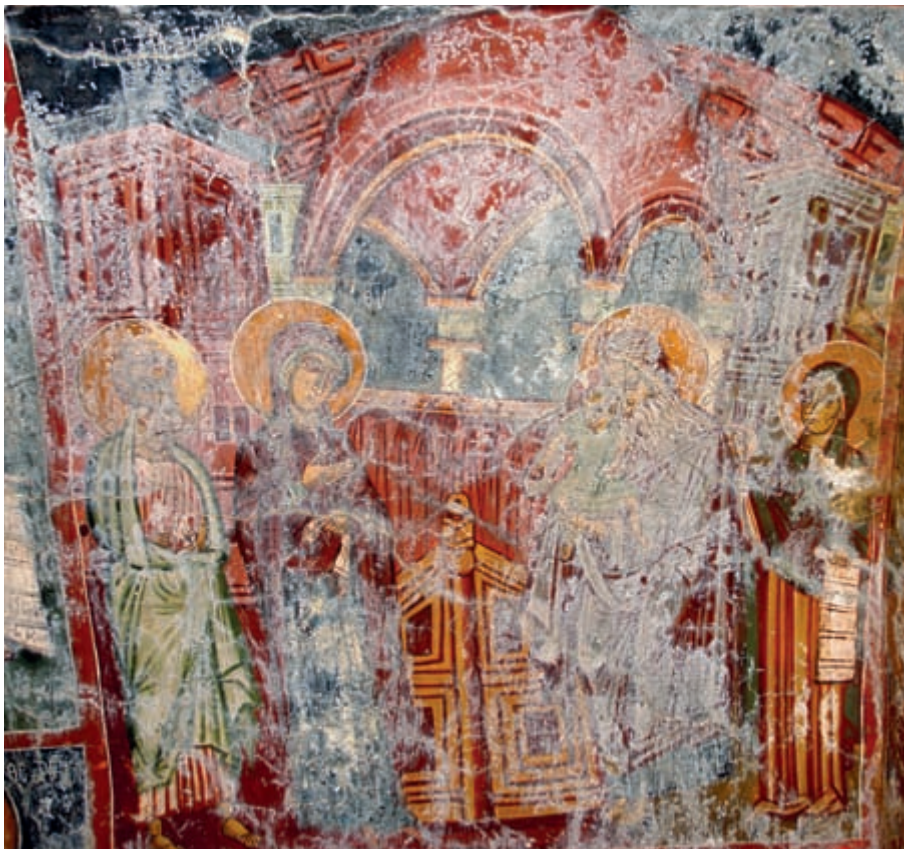
Abb. 128: Chasi, Hagios Ioannes. Darbringung im Tempel