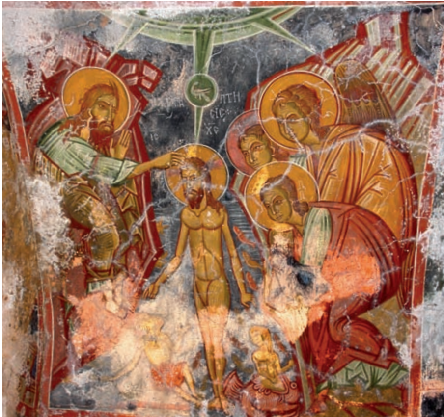
Abb. 127: Chasi, Hagios Ioannes. Taufe Christi