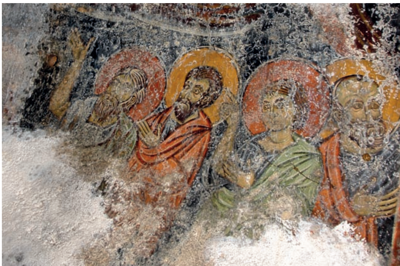
Abb. 155: Kalamos, Hagios Ioannes. Himmelfahrt