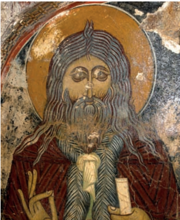
Abb. 150: Trachiniakos, Prophet Elias. Kirchenpatron