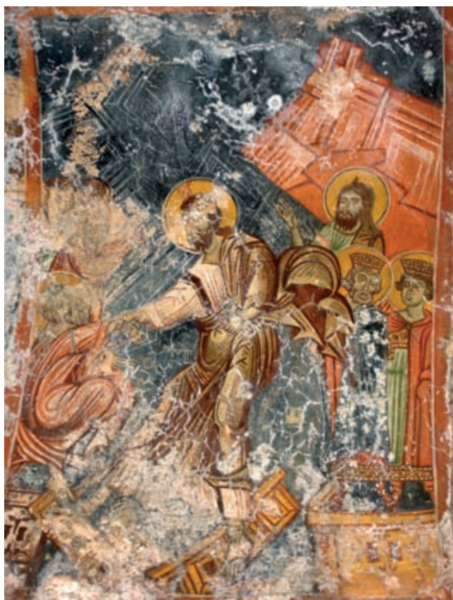
Abb. 154: Kalamos, Hagios Ioannes. Anastasis