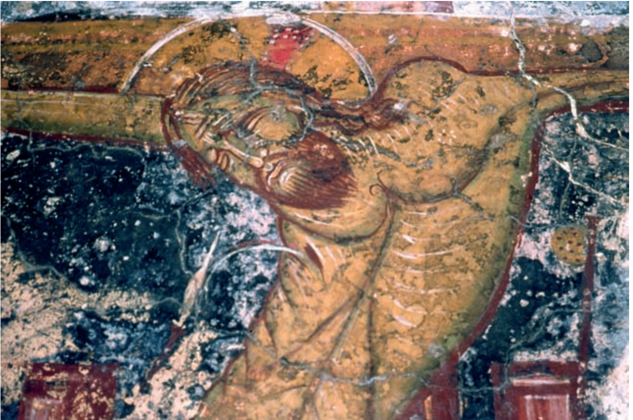
Abb. 136: Prines, Panagia. Kreuzigung