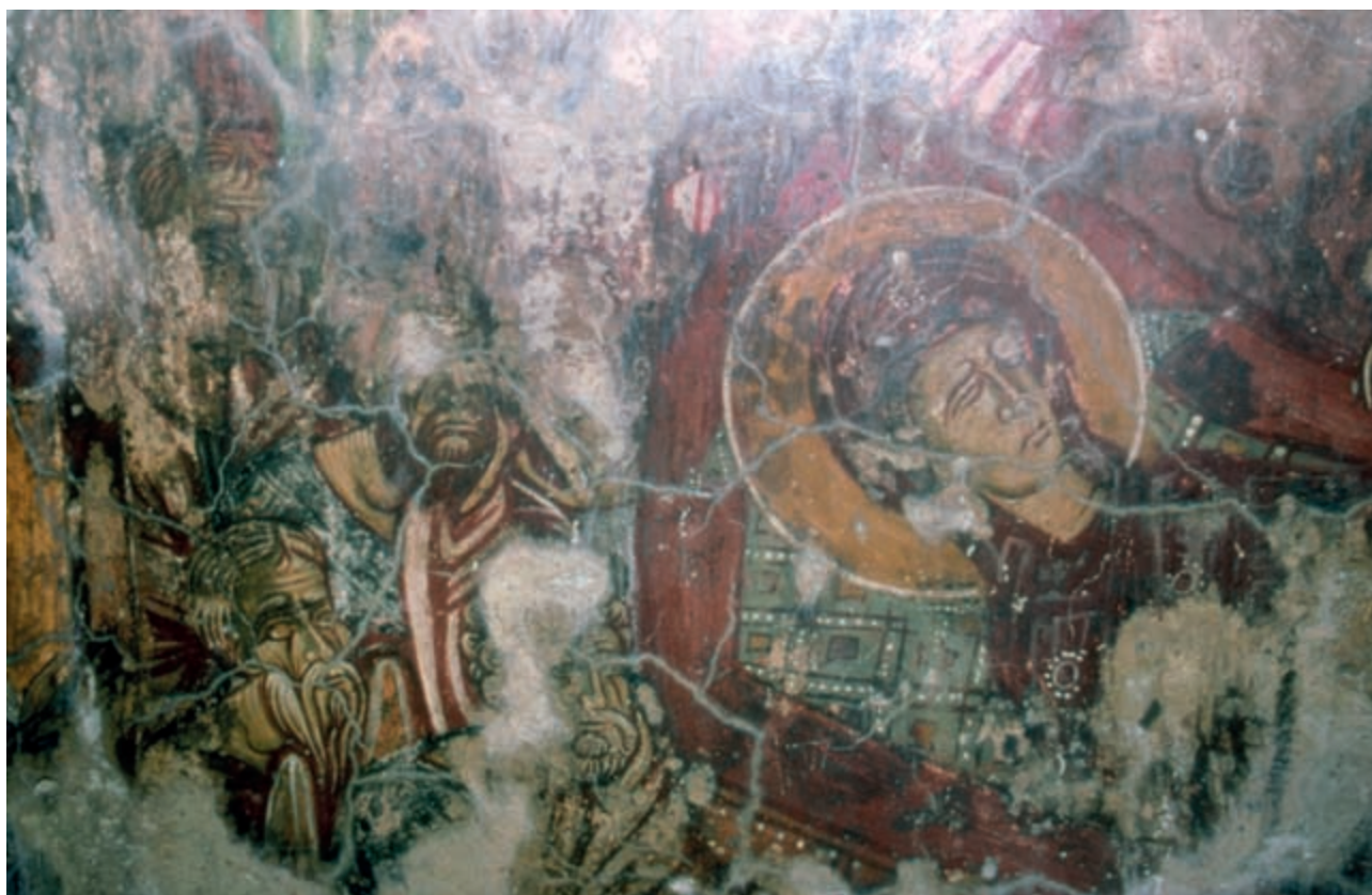
Abb. 135: Prines, Panagia. Koimesis