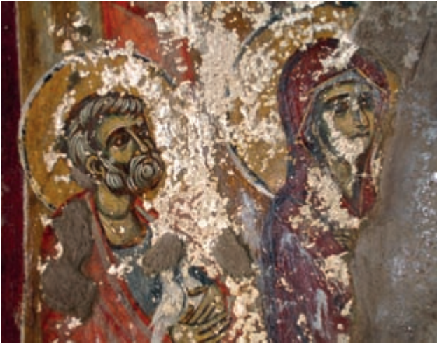
Abb. 142: Anisaraki, Hagia Paraskevi. Darbringung im Tempel