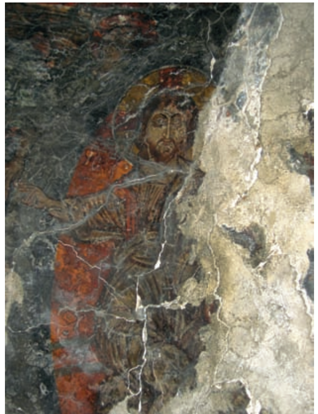
Abb. 138: Prines, Panagia. Himmelfahrt