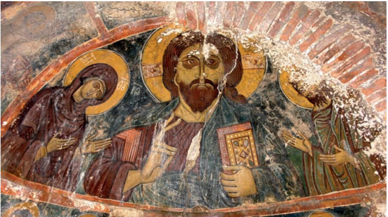
Abb. 149: Trachiniakos, Prophet Elias. Deesis