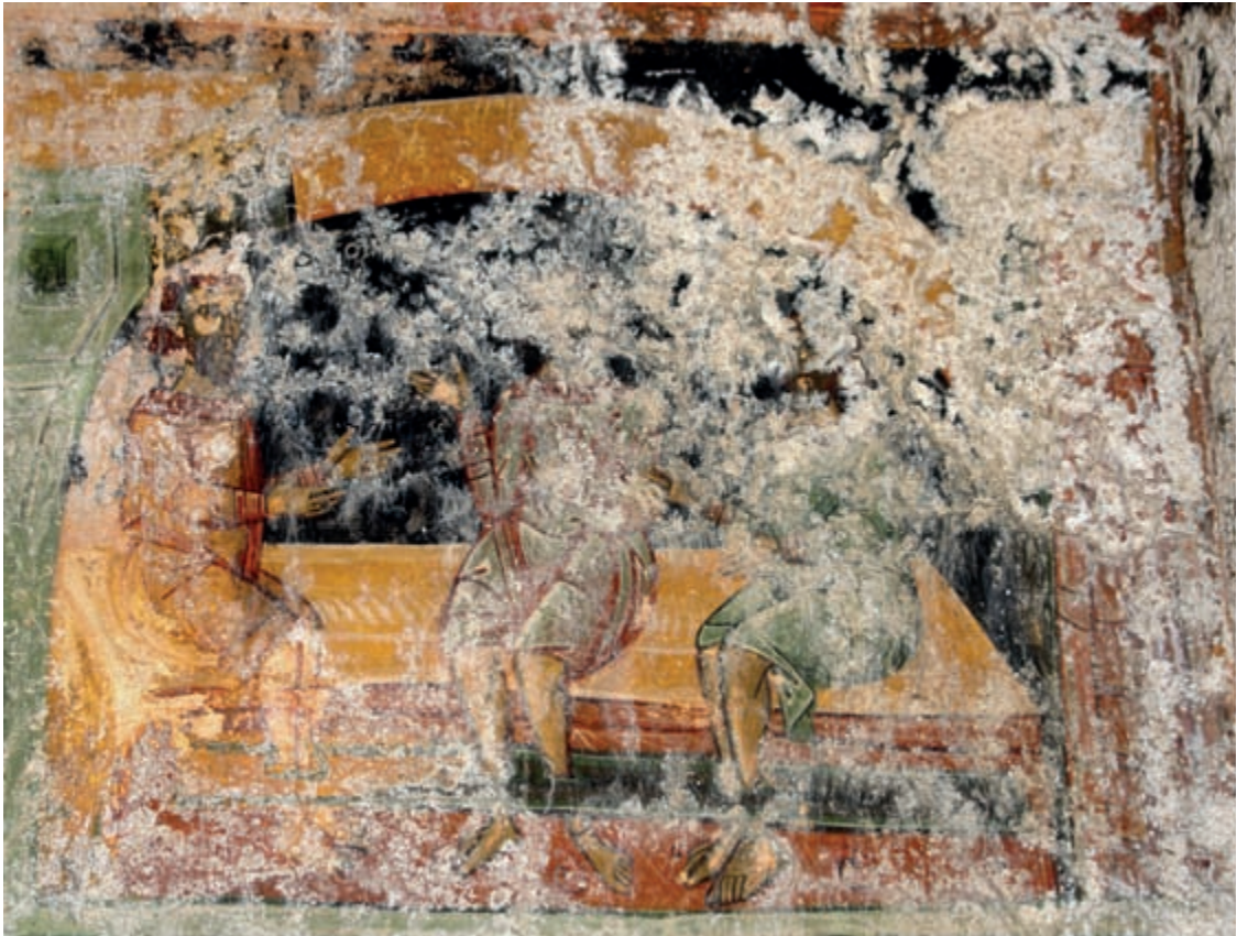
Abb. 131: Kitiros, Hagios Nikolaos. Szene aus dem Nikolaoszyklus