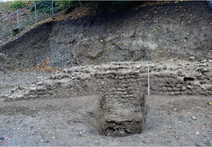
Abb. 3: Mauer B des Römischen Theaters während der Ausgrabung im November 2019

Lausanne (Schweiz), die ins frühe 2. Jahrhundert n. Chr. datiert werden. 8