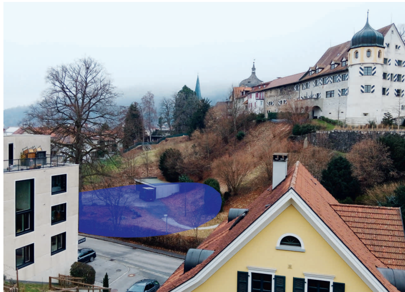
Abb. 1: Lage im Gelände (blau), Römisches Theater am Thalbach, Bregenz

Sechs Jahre später, 2019, stießen die Mitarbeiter:innen des archäologischen Dienstleisters Context KG circa 7 m weiter nördlich, in der Baufläche der heute bestehenden Garage, auf zwei weitere im Abstand von 3 m konzentrisch verlaufende Mauersegmente. 2 Die auf circa 3 m Länge freigelegte Mauer A (Nord) bildet die Fortsetzung des inneren Rings. Zum äußeren Ring gehört die (einschließlich Fundament) 2 m hoch erhaltene und 9,5 m lange Mauer B (Abb. 3). Diese zeigt an der Innenseite im Aufgehenden noch Verputzreste. Die nachgewiesenen Mauern sind als Schalenmauerwerk aus gerundeten Bachsteinen im Mörtelverband ausgeführt. Die Mauerstärke liegt zwischen 1,20 und 1,50 m. Die Mauern sind somit doppelt so dick wie gewöhnliche römerzeitliche Gebäudemauern, was mit einer starken statischen Beanspruchung zu erklären ist.